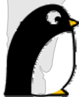
項目別の概算削減量