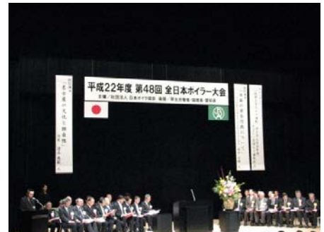
表彰式（愛知県産業労働センター）